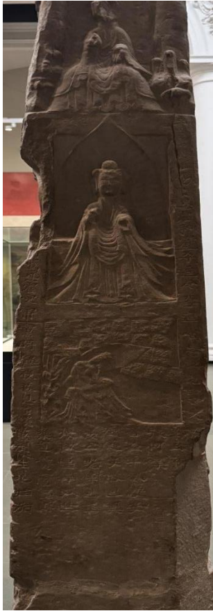
图 6 碑身右侧面