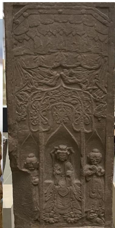
图 9 碑阴下半部