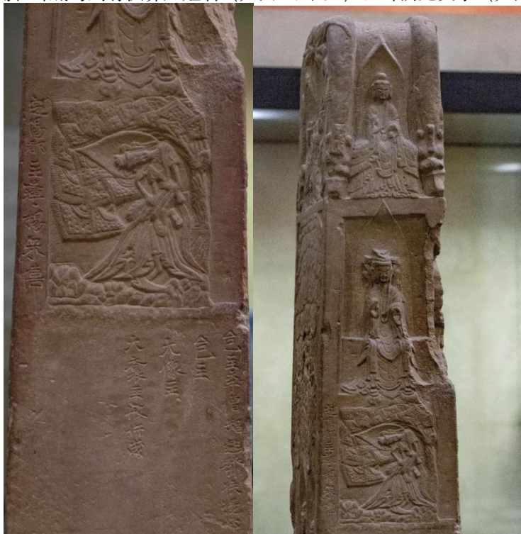
图4 碑身左侧面铭文图

碑身右侧面中层龕两侧和碑底均刻有供养人姓名（如图6、图7）。碑阴无文字（如图8、图9）。