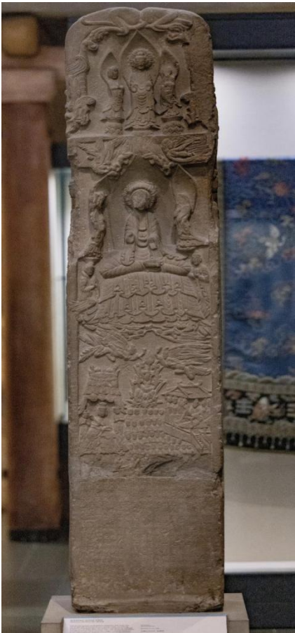
图 2 碑阳