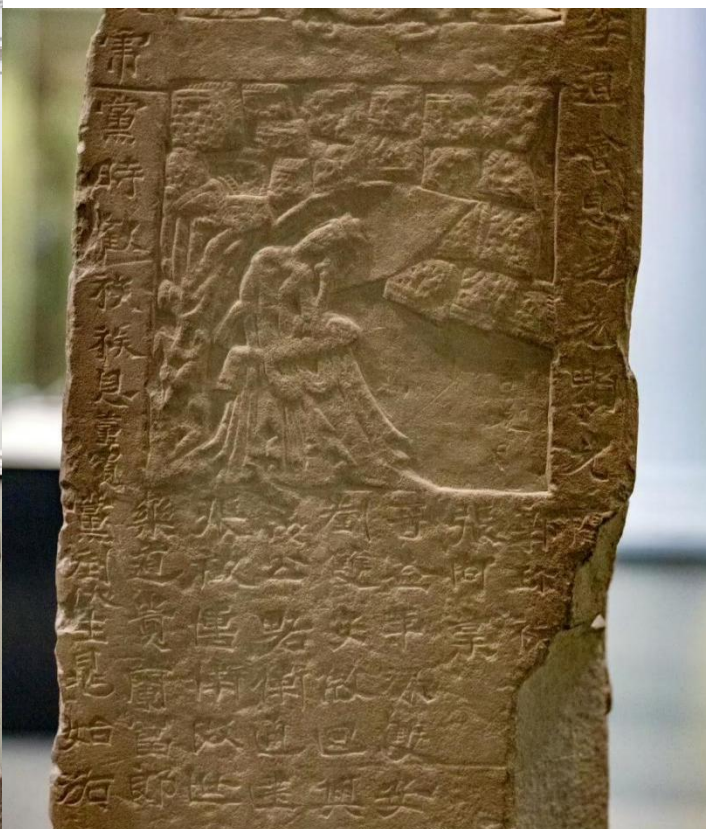
图 7 碑身右侧面铭文图