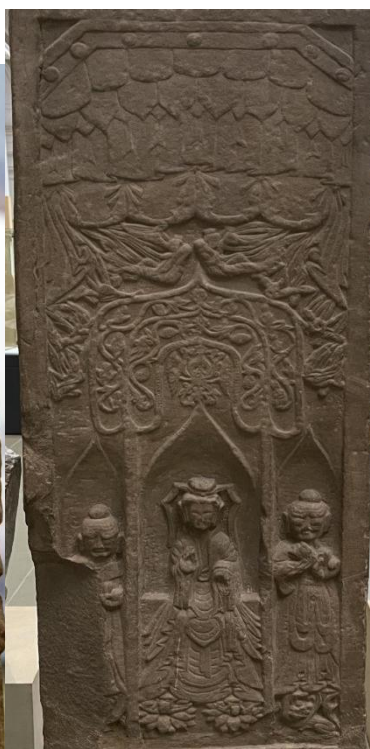
图 9 碑阴下半部