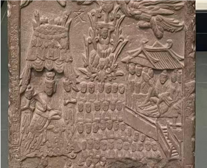
图 1 碑阳下层龕文字