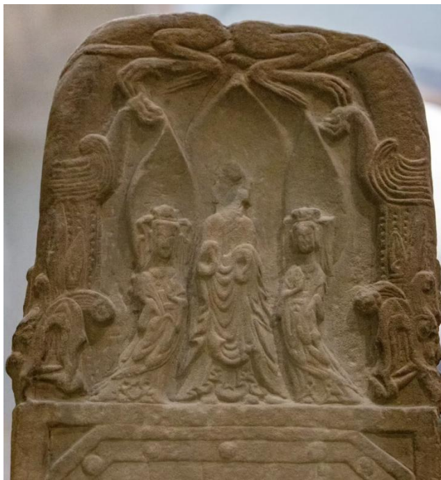
图 8 碑阴上半部