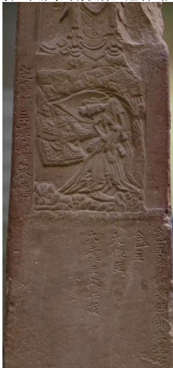
图4 碑身左侧面铭文图

碑身右侧面中层龕两侧和碑底均刻有供养人姓名（如图6、图7）。碑阴无文字（如图8、图9）。