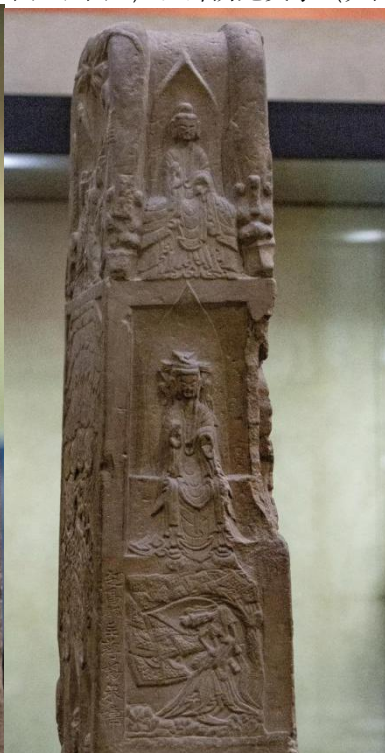
图5 碑身左侧面图像