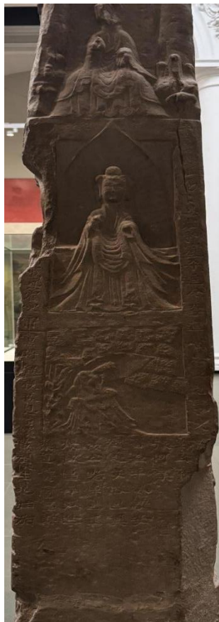
图 6 碑身右侧面