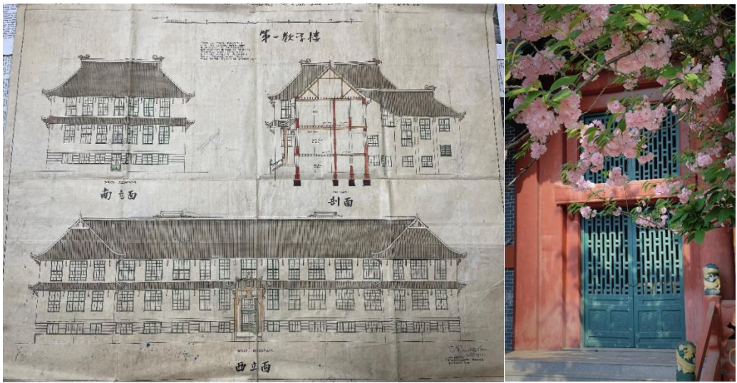
图 1 嘉德堂（一教）1922 年的设计图纸与 2025 年的正面实景