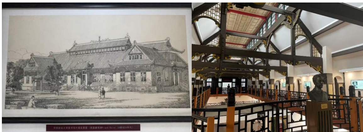
图 3. 懋德堂（原图书馆、现医学博物馆）建成之初的实景图与现在内部景观