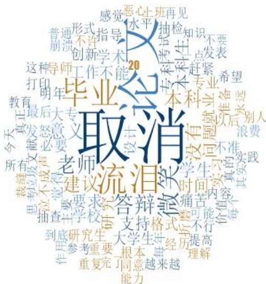
图 1 本科生取消毕业论文网络评论词云图