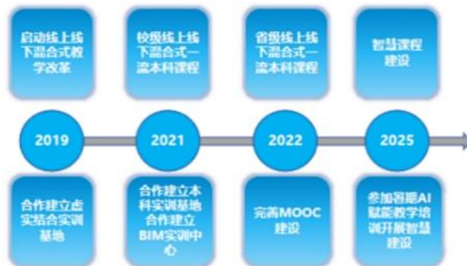
图 1 课程建设历程

课程自 2019 年启动线上线下混合式教学改革到 2025 年建设智慧课程（见图 1），经六年实践探索与优化，形成了适配地方工科院校办学定位、贴合行业发展需求的创新教学模式。