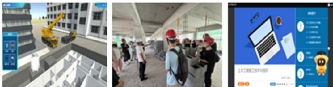
图 3 多元教学环境