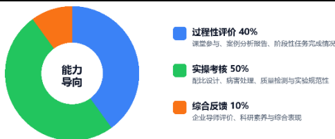
图 2 课程三维评价体系权重结构示意图