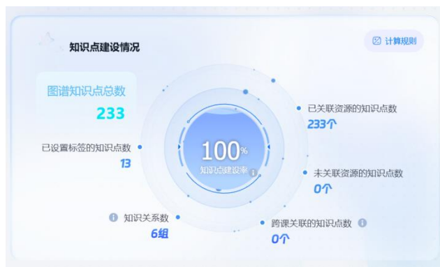
图2 风景园林规划设计课程知识点构建