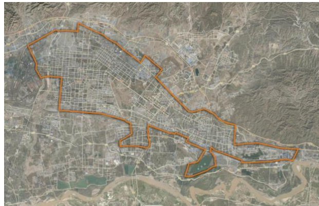
图 1 包头市建成区城区维度调研范围

(3) 抽样调查数据: 采用分层随机抽样方法, 在全市五个主要辖区(昆都仑区、青山区、东河区、九原区、稀土高新区)发放问卷 450 份, 回收有效问卷 400 份, 有效回收率 88.9%, 用于获取居民对社区服务、人居环境满意度的感知信息, 同时对乱停车等管理数据进行交叉验证。