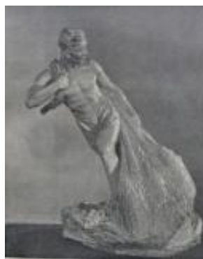
(f)叶毓山《体操》石膏 1956年