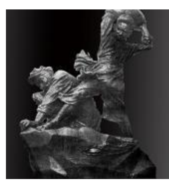
(d)龙德辉《坚守》石膏 1955年