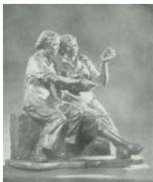
(e)叶毓山《优质纱》石膏 1956年