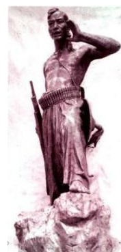
(c)伍明万《彝族民兵》石膏 1956年