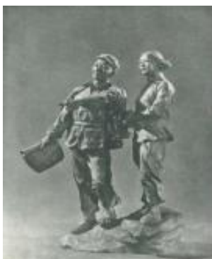
(c)龙德辉《规划》石膏 1955年