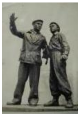
(a)赵树同、郭其祥《苏联专家与中国工人》 石膏 1954年