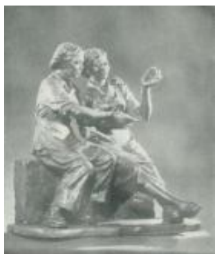
(e)叶毓山《优质纱》石膏 1956年