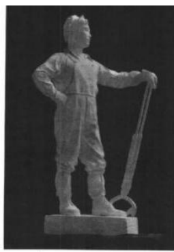
(b)郭其祥《轧钢工人》石膏 1953年