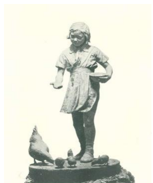
(b)郭其祥《我养的鸡》石膏 1954年