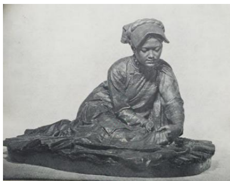
(b)郭其祥《裁衣》石膏 1956年