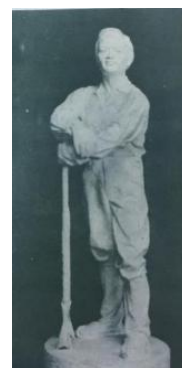
(c)郭乾德《紧张中的小息——轧钢工人》石膏 1953年