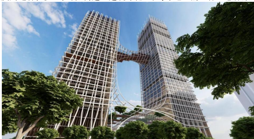
图 2 高层建筑的通风幕墙设计（作者绘制，2024 年）

生态与美观设计：建筑外墙采用 Low-E 玻璃幕墙，在不同光照条件下产生丰富光影变化，增强建筑动态美感；为践行可持续发展理念，整栋楼优选环保材料，采用太阳能等可再生能源与节水系统，融入屋顶花园、连桥绿化等生态元素优化微气候，20 层空间连桥优化视野设计，提供良好景观体验；环岛中心及周边种植乡土植物，构建“建筑绿化+环岛绿地”的立体生态体系，提升区域绿量。