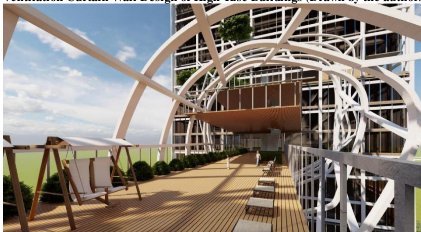
图 3 空间连桥（作者绘制，2024 年）