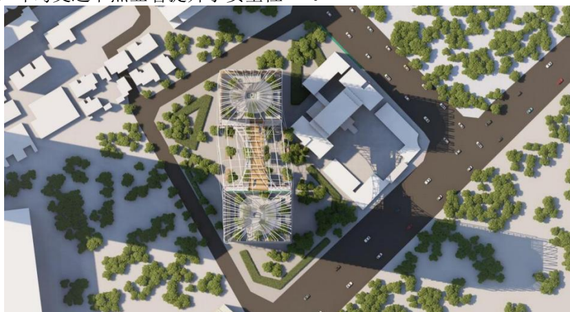
图 4 环岛道路结构总平面图（比例 1: 500 作者绘制，2024 年）

环岛道路结构（图 4），作用是在避免或减少红绿灯的前提下，保持车流通畅，提高通行效率 [9] ，以高层建筑为中心，延伸至四周，十字路口五十米内设立禁停区，道路形成方形全包围式环岛结构。在街道一体化设计原则下，充分考虑与周边的商务办公区、生活休闲街道以及公园绿地的无缝衔接。在确保交通可达性的同时，尽量保护场地植被，提供充足绿量。同时挖掘场地文化特质，作为设计的思考方向 [10] 。环岛交通节点显著提升了安全性 [7,9] 。