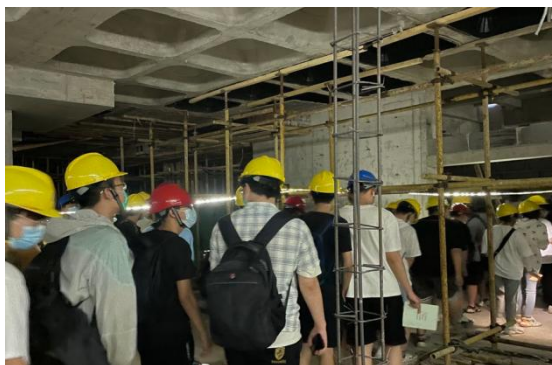
图 2 工程实践

依托校外教学科研实习基地，将工程实践环节加入到课程体系之中（图 2），实现知识从书本到工程实际的转化，进而建立“科研+教学+实践”课程模式。